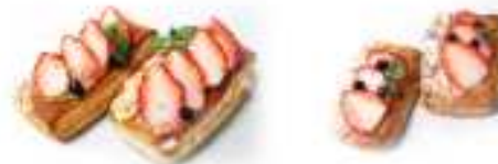
いちごデニッシュ